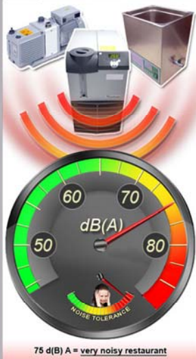
For example, standard noisy equipment without MS NOISE Noise Reduction Enclosure

ラボにおける騒音は作業者にとって大きなストレスとなります。一定レベルを超える騒音は人体に障害を引き起こし、蓄積性があります。 ラボにおける静穏な作業環境を提案します。